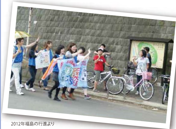
2012年福島の行進より

今日では全都道府県の8割を越える自治体を通り、毎年約10万人が参加しています。「核兵器のない平和で公正な世界」を願う人なら、誰もが参加できます。